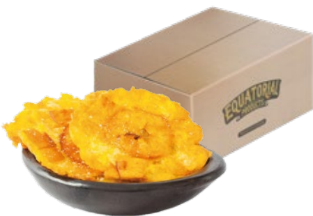
Reference image/Imagen referencial***

Manga de PEBD, 0,0023 micras, plain o impresas.